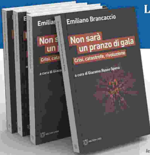
■ Non sarà un pranzo di gala (Meltemi Editore)