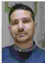
■ Giacomo Russo Spina (imagoeconomica)

nanzitutto "pubblica" perché questo è "l'unico strumento in grado di mettere ordine in un tale sconquasso". Per organizzarla, però, è necessario un cambio radicale di paradigma. Nel modo di concepire il ruolo delle banche, dei burocrati, della politica e - dopotutto - di tutti noi. Certamente non sarà facile: la strada, per dirla ancora con l'economista, è "inedita e sovversiva". Ma l'alternativa è il neoliberismo autoritario. Rimbocchiamoci le maniche, dunque: "l'orizzonte catastrofico è più vicino. Un'intelligenza collettiva rivoluzionaria è tutta da costruire".