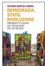
DEMOCRAZIA, STATO, RIVOLUZIONE Álvaro García Linera Meltemi, 2020. 18 euro

Per mezzo, poi, di quella fenomenologia del rivolgimento politico-statale che emerge nei capitoli centrali – una vera e propria dissezione del processo politico di presa del potere –, si rivela l'intima prospettiva di chi ha guidato la prassi di quella stagione di governo. Una prospettiva in doppia copia, verrebbe da dire, quella del sociologo e del politico ovvero della scienza al servizio della prassi. Una relazione che alle nostre latitudini non significa più nul-