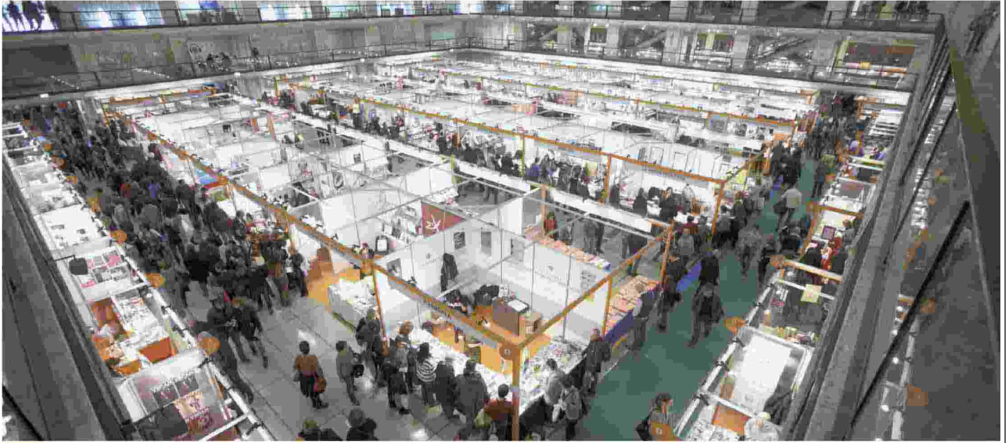
ROMA. Gli stand di "Più libri più liberi"