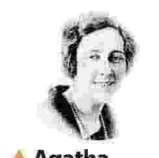
▲ Agatha Christie