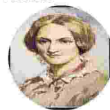
▲ Charlotte Brontë