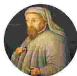
▲ Geoffrey Chaucer