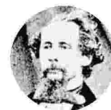
▲ Charles Dickens