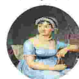
▲ Jane Austen