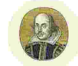
▲ William Shakespeare