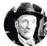
▲ William S. Burroughs