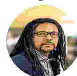
▲ Colson Whitehead