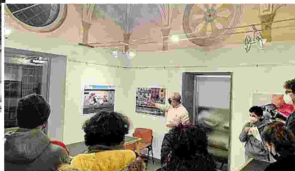
Alcune immagini delle mostre e delle opere realizzate per il progetto

Il titolo fa riferimento al numero del Cap sandonatese: il progetto vuole valorizzare le opere di street art del territorio